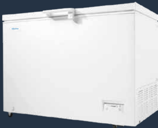
MODÈLE 311F ●

7.2pi3 - 12 / 24 volt 33 1/4 x 40 x 22 1/5