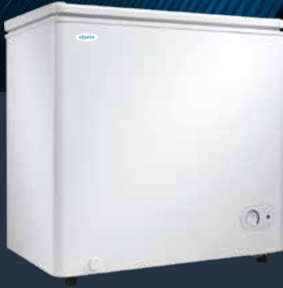
MODÈLE 156F ●

5.5pi3 - 12 / 24 volt 33 1/4 x 32 3/8 x 20 7/8