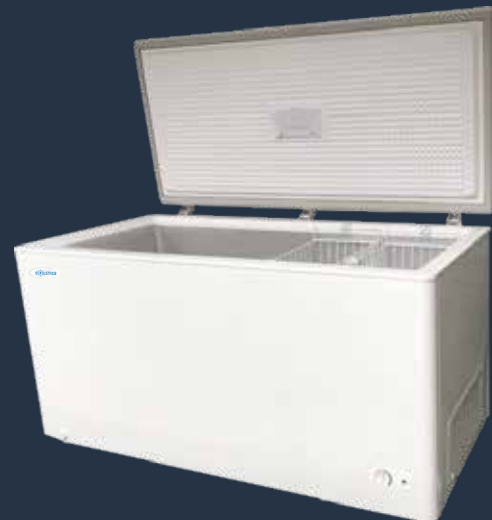
MODÈLE 412F ●

11pi3 - 12 / 24 volt 33 1/4 x 44 x 27 1/2