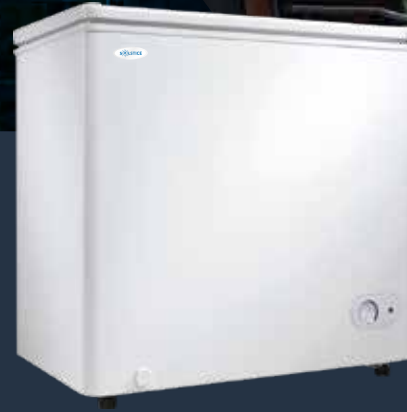
MODÈLE 204F ●

5.5pi3 - 12 / 24 volt 33 1/4 x 32 3/8 x 20 7/8